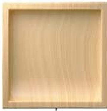
PP-179 プラスチリ角(モクレン)