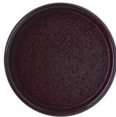
PF-110 新打出嵐二寸丸(茶)