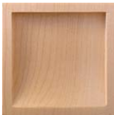
PW-120 モミジ片チリ角(クリアー)